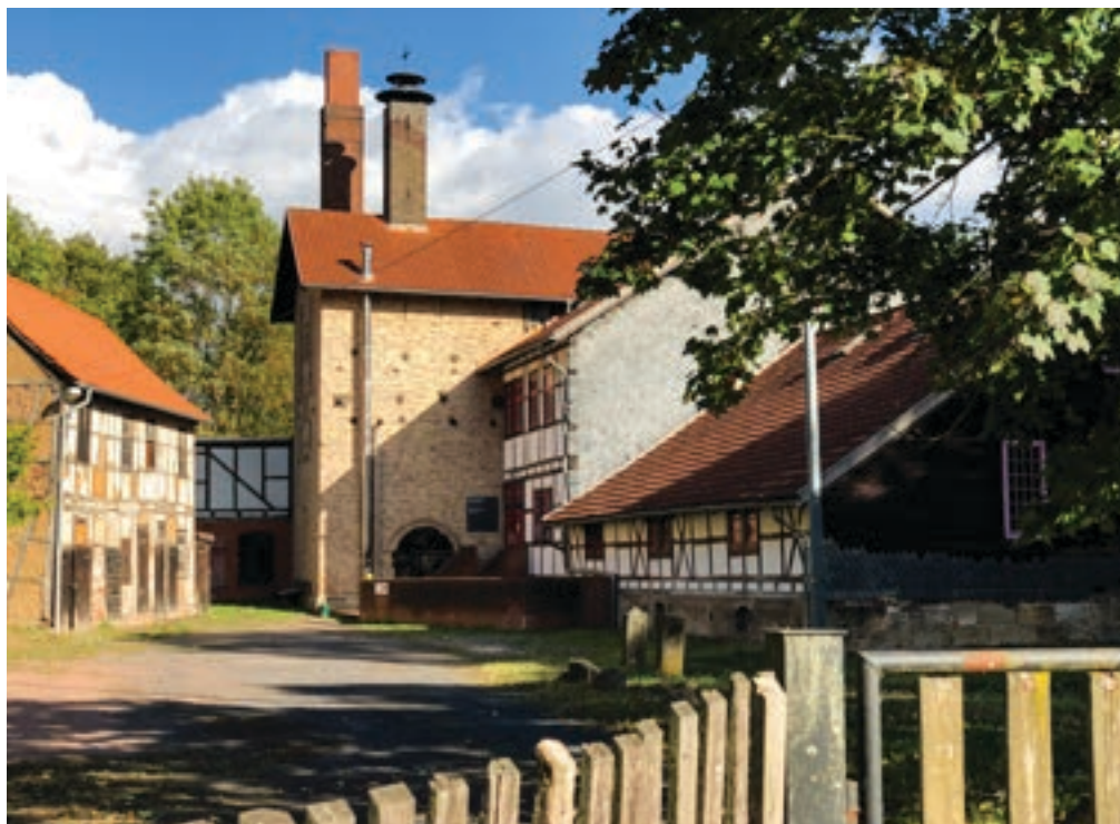
Alte Mälzerei